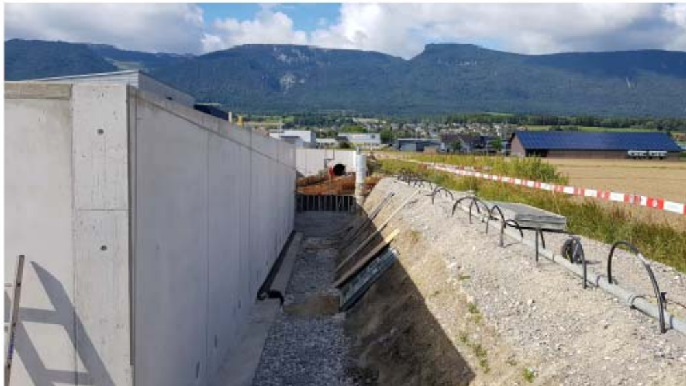
Blick Richtung Norden zum Überlauf in die Retentionsfläche