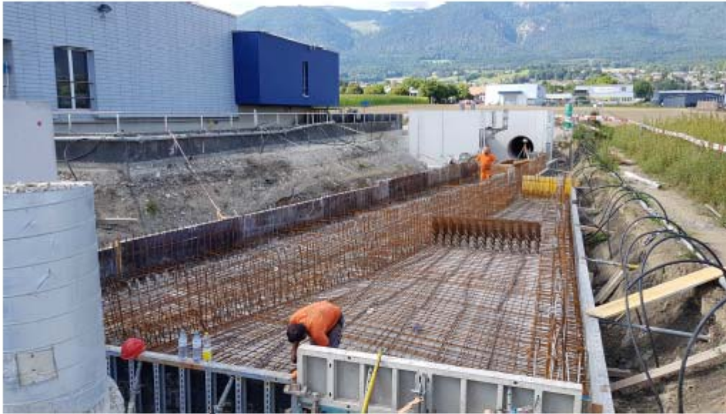
Der Zuführkanal mit Überlauf (Standort Fotograf). Zulaufrohr in Trennbauwerk (mit Messgerät)