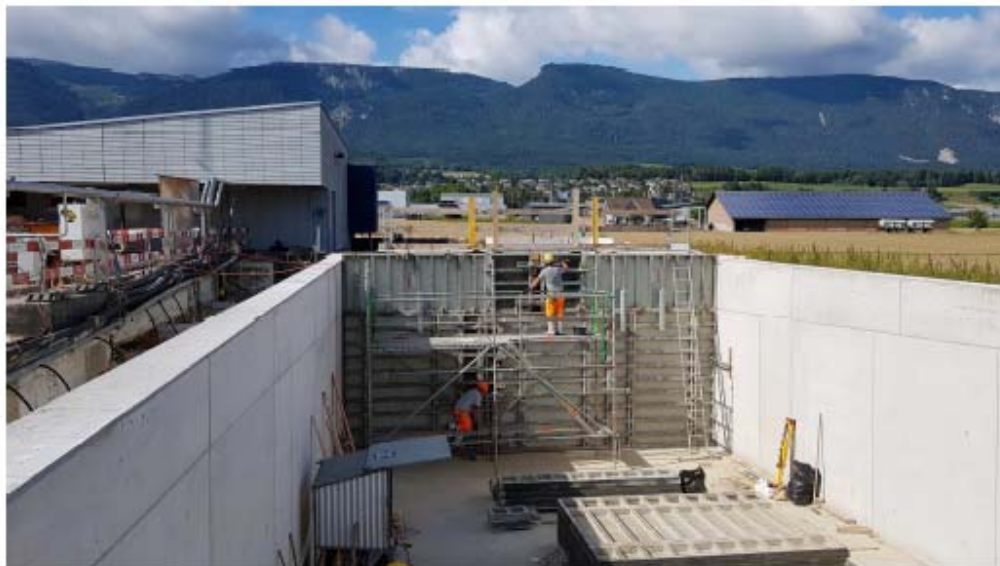
Blick in das Rückhaltebecken (500m 3 ). Tauch wand wird betoniert.