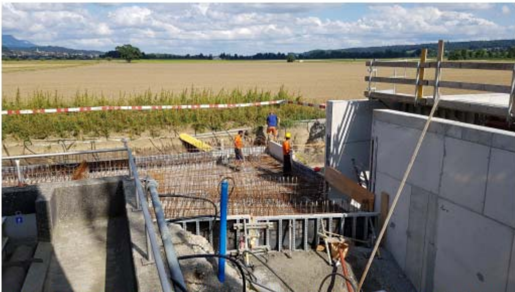
Blick auf den südlichen Teil des Zuführkanals, rechts geht's in das Rückhaltebecken. Im Vordergrund die immer noch arbeitende zusätzliche Pumpe (roter Schlauch)