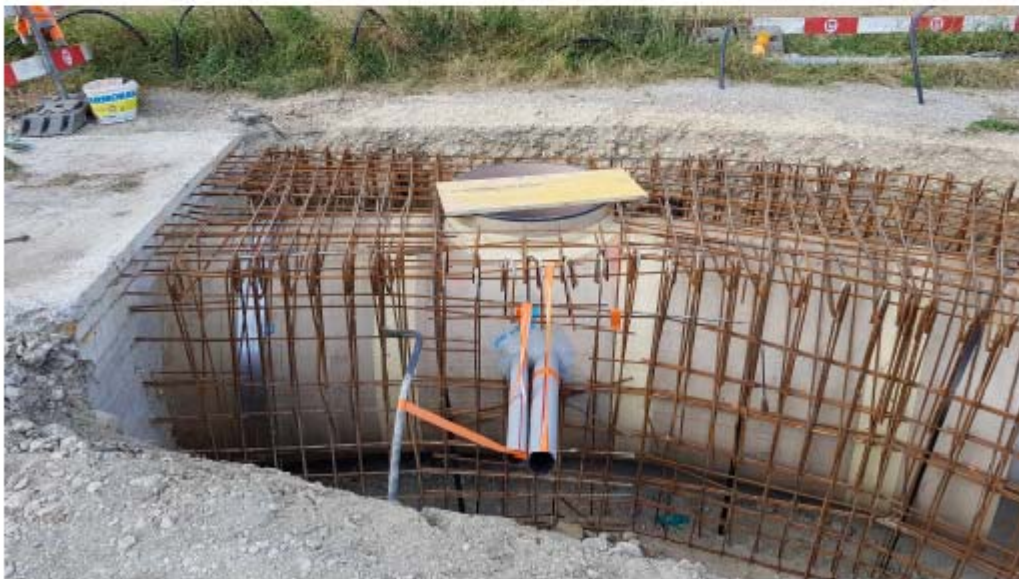
Zulaufrohr in Trennbauwerk mit Anschlüssen für Steuerung, bereit zum einbetonieren